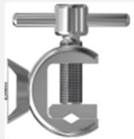
スタンダード仕様 (挟み式)