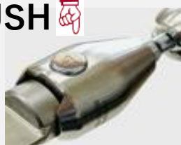
クイックコネクター仕様 (ワンタッチ脱着式)