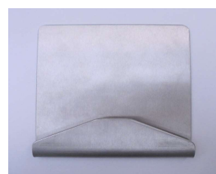
S-FLX-101-04 CHIROBLOC ベース