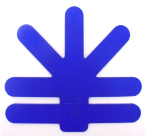
S-FLX-101-02 CHIROBLOC スモール