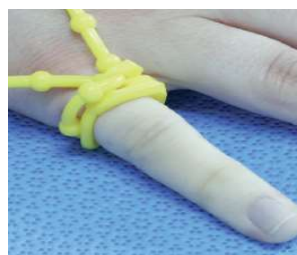
S-FLX-101-03 フォゲットミーノット